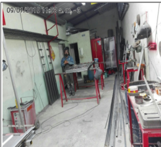
FOTOGRAFÍA No 3. AREA DE CORTE, SOLDADURA Y PULIDO DE MATERIAL