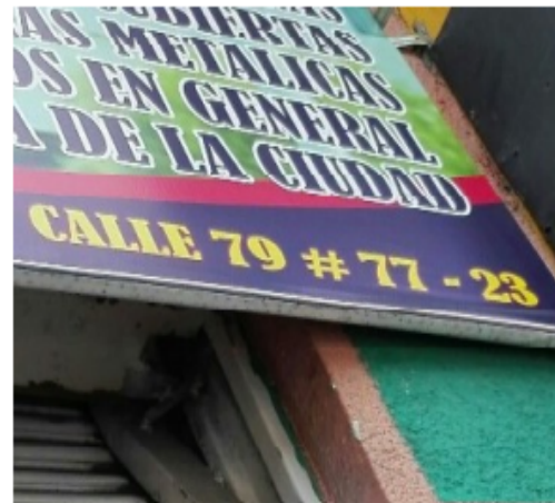
FOTOGRAFÍA No 2. PLACA DEL PREDIO