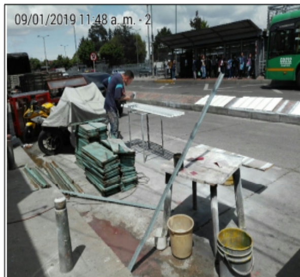
FOTOGRAFÍA No 4. USO DE ESPACIO PUBLICO PARA LA APLICACIÓN DE PINTURA